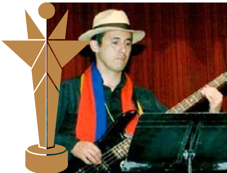
Colegio Ciudadela Educativa de Bosa I. E. D