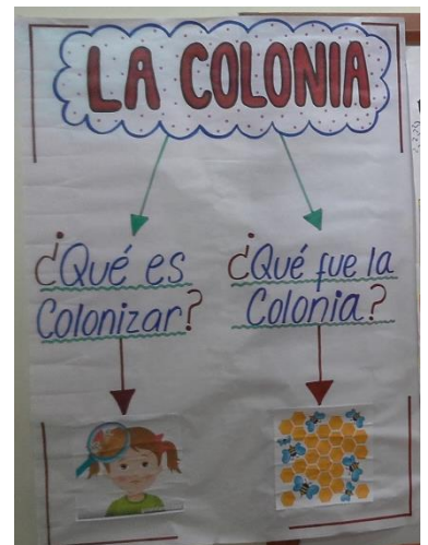
Algunos de los recursos visuales utilizados por los estudiantes en su exposición.